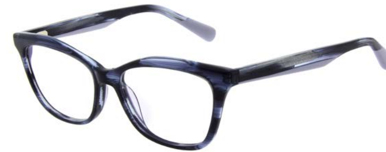
609 BLUE HORN