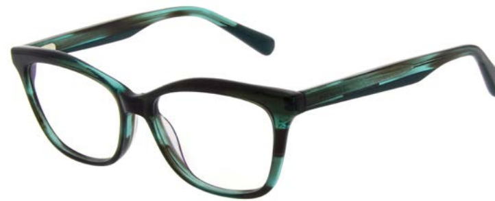
ELISA MM1023 (PDM009631)