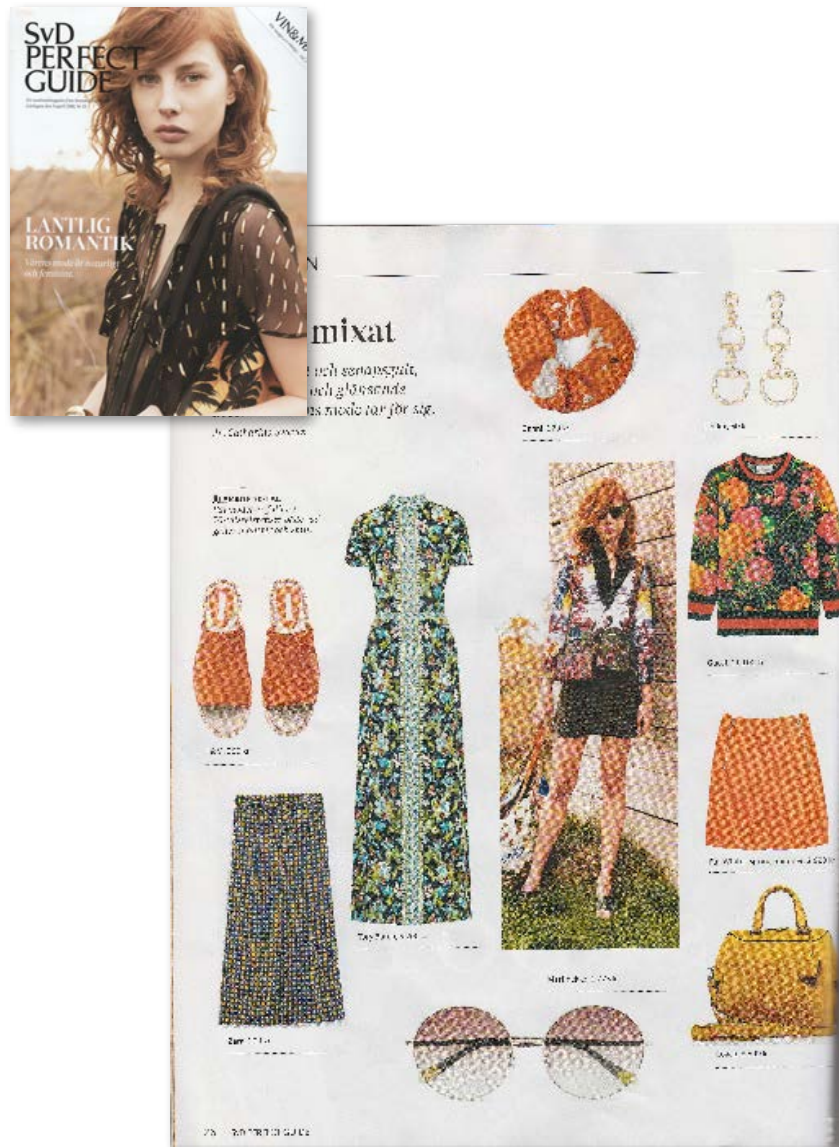
Svd Perfect Guide - Sweden Style: ELLA MM7001