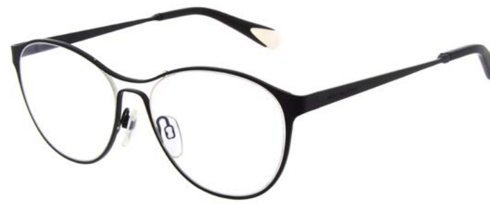
SINI MM3010 (PDM009660)