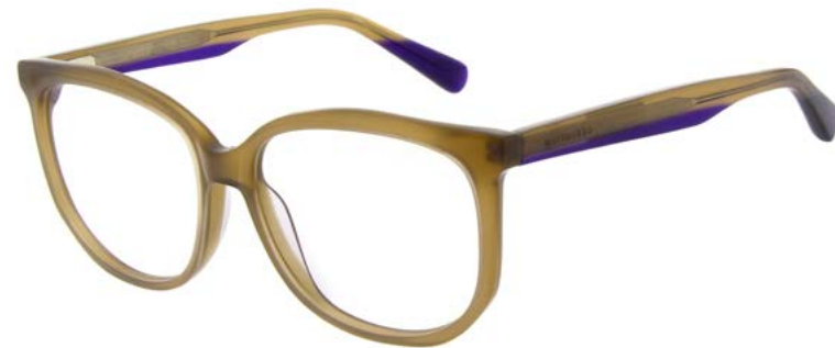
197 MILKY TAUPE

CHANGE TEMPLE TIP ACETATE LAMINATION TO SOLID MAUVE AS PDM009627 COL 708