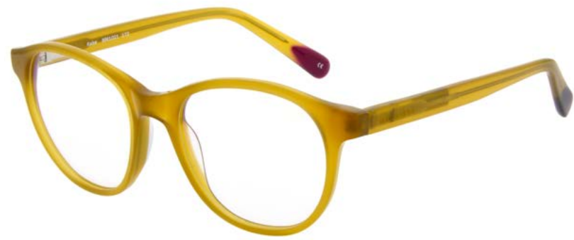
172 MILKY BROWN