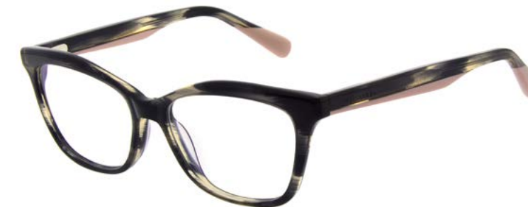
907 GREY HORN