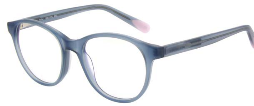
653 MILKY BLUE/GREY