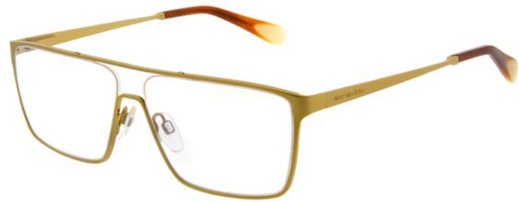
HILKKA MM3009 (PDM009621)