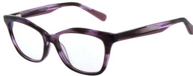
708 PURPLE HORN