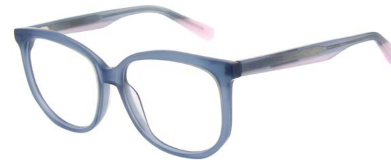
653 MILKY BLUE

CHANGE TEMPLE TIP ACETATE LAMINATION TO SOLID MAUVE AS PDM009627 COL 708